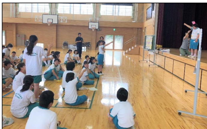
授業風景（中学部：交流及び共同学習）