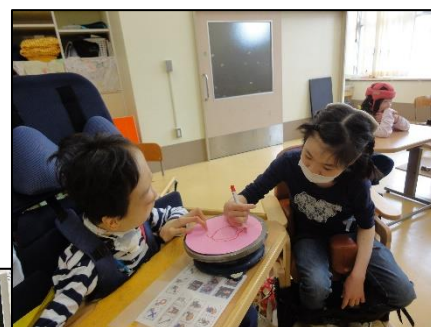
授業風景（小学部図工）