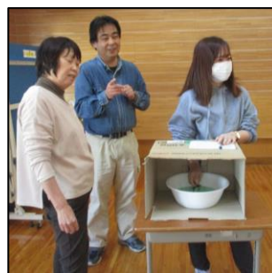
授業風景（ふれあい活動：ドミノ倒し、児童生徒企画「スライム工場」）