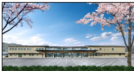
校舎（イメージ図）R2.6月全面完成予定