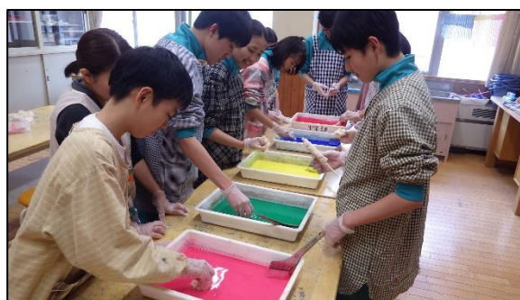
授業風景 (中学部：美術)