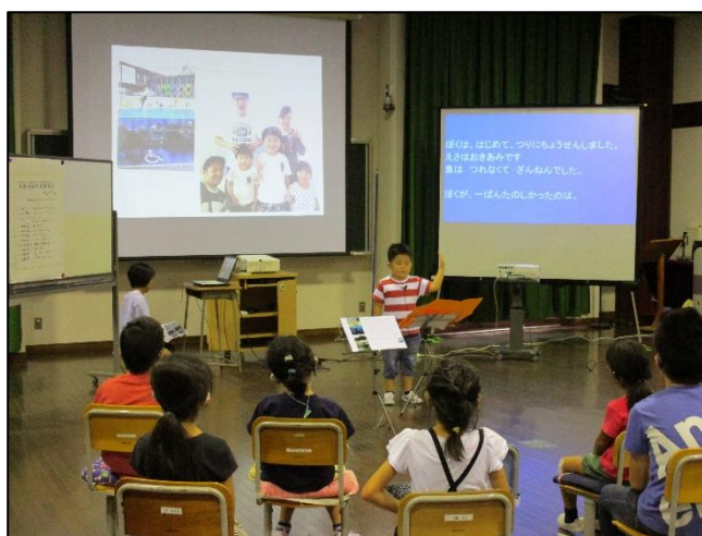
夏休み生活発表会・自由研究発表会（小学部）

オ 学校間交流や地域の人々との交流活動では、社会的経験とふれあいを深め、良き社会人となるための素地を養っている。