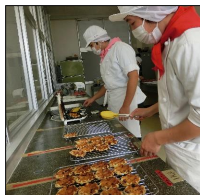
授業風景（食品加工コース ワッフルの焼成）