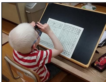
授業風景（単眼鏡や書見台を活用した授業：小学部）

ウ 「Eye 愛ひとみ相談支援センター」を開設し、県内視覚障害児者に対して、視覚的ケア、補助具の活用、育児相談、教材や指導法の助言、入学・進学相談、拡大教科書の紹介等、ニーズに応じたサポートを行っている。また、専門家と連携し、小・中学校在籍弱視児童生徒への支援、定期相談・臨時相談・継続相談・巡回相談等を随時実施し、地域の視覚障害教育の専門機関としてセンター的役割を果たしている。