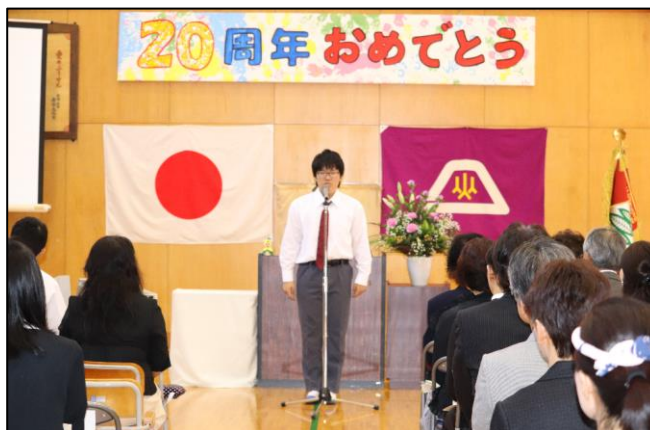
創立20周年記念式典 (R1, 10, 9)

ウ 特別支援教育のセンター校として、地域の関係機関と繋がり、積極的な情報発信、支援連携を行っている。