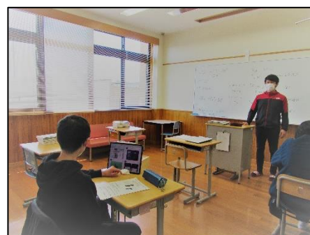
授業風景（中学部）学活