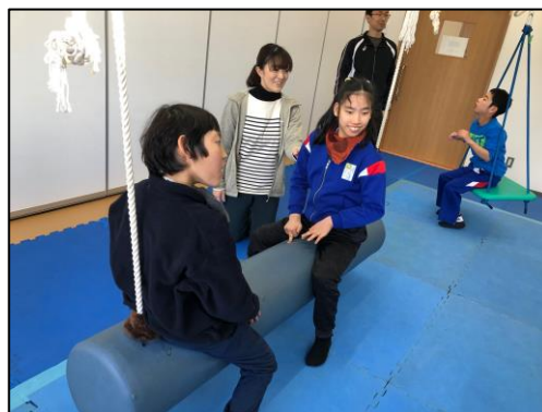
授業風景（新設の上下肢訓練室にて）