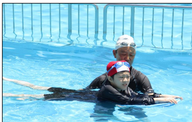
授業風景【中学部：保健体育（水泳）】