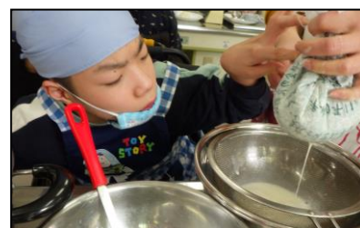
中学部 (合わせた指導)