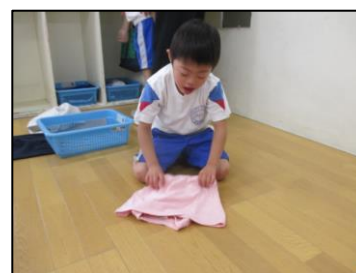
授業風景(小学部：日常生活の指導)

エ 附属学校として取り組む教育実践及び研究を通して、県内外の特別支援学校や小中学校を対象とした、特別支援教育の推進に取り組んでいる。