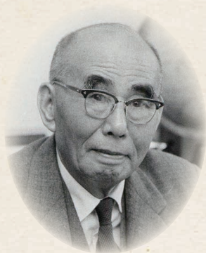
いしばし たんざん 石橋 湛山

山梨県の葡萄栽培、ワイン醸造 の基礎作りに尽力。技術書『葡 萄三説』を著してその普及に努 めた。