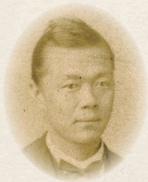
すぎうら ゆずる 杉浦 譲

「アラビアンナイト」の紹介で知ら れる翻訳家。近代日本の西洋文 化の受容を推進した。