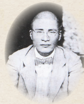
あさかわ たくみ 浅川 巧

「小日本主義」を唱えたジャーナ リスト。第55代内閣総理大臣。 中華人民共和国との国交回復 にも尽力した。