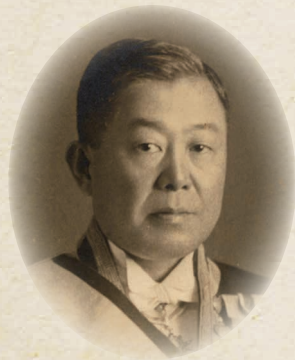
はにはら まさなお 埴原 正直

彫刻家で朝鮮半島の陶磁器の 研究家であり教育者。「朝鮮古 陶磁の神様」と称される。