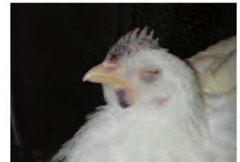
肉冠の壊死 肉垂のチアノーゼ