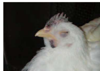
肉冠の壊死 肉垂のチアノーゼ