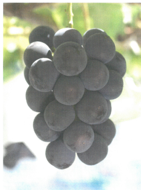
図2 「甲斐のくろまる」の果実