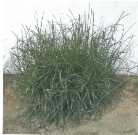
「ヤツマサリ」の草姿

山梨県内では標高500m以上で、採草・放牧兼用草地または放牧専用草地で活用できる。