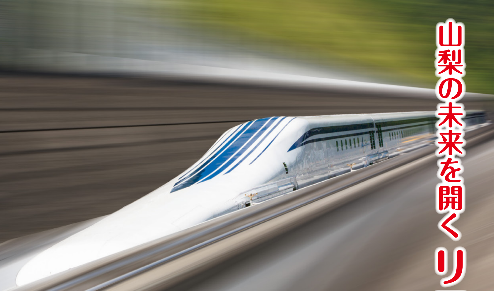
超電導リニアL0(エル・ゼロ)系車両