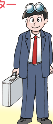
ヒロシ 研究者 ピョン吉AIを開発