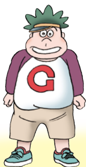
ゴリ作 ゴリライモの息子