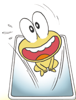
ピョン吉 ヒロシが開発した万能AIツール