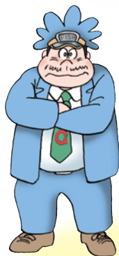
ゴリライモ ヒロシの同級生