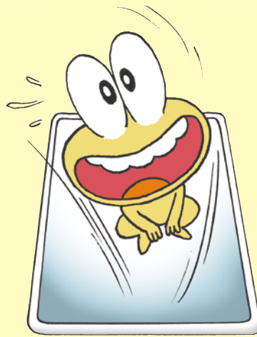
ピョン吉 ヒロシが開発した万能AIツール