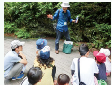
森のガイドウォーク(解説員による森の紹介)

開催日／7月8日(土)、9日(日)、15日(土)、16日(日)、17日(月・祝)、22日(土)～31日(月) 8月1日(火)～20日(日)、26日(土)、27日(日) 開催時間／①10:00～ ②11:00～ ③13:00～ ④14:00～ ⑤15:00～ 所要時間は約50分 参加料／無料