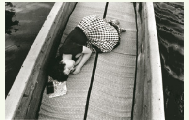
荒木経惟(センチメンタルな旅)より 1971年 富士フィルム株式会社蔵

開催期間／7月1日(土)～8月20日(日) 観覧料／一般1,000円 大学生500円 ※各種割引などあり。詳しくはお問い合わせください。