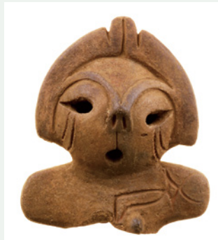
土偶 いっちゃん(重要文化財) 一の沢遺跡(笛吹市) 縄文時代中期