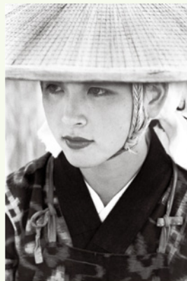
木村伊兵衛(秋田おぼこ 秋田・大曲) 1953年 富士フィルム株式会社蔵

1848(嘉永元)年に写真技術が伝来して以来、日本では多くの優れた写真家が作品を残してきました。本展では、その中でも特に重要な101人の写真家が撮影した「この1枚」と呼べる代表作を展示し、日本写真史の軌跡を紹介いたします。幕末の写真をはじめ、戦前戦後に活動した木村伊兵衛などの代表作、そして荒木経惟といった今日現役で活動する写真家たちの作品など、日本写真史を語る上で欠かせない作品をぜひご覧ください。