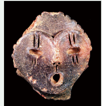
土偶 桂野遺跡(笛吹市) 縄文時代中期