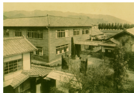
甲府市湯田町に建設された山梨裁縫学校

(申込みの際に氏名、お住まいの市町村名、連絡先をお伝えください) * 防災新館地下駐車場をご利用の受講者の方は駐車券をお持ちください。無料になります。