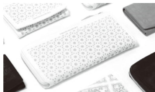
図2 試作品（名刺ケース・長財布）

本研究で試作する印伝製品に使用するための新柄の開発に取り組んだ。スクリーン印刷版を簡易型紙として用い、漆文様の仕上りを確認しながらドット等の間隔や大きさなどの調整を行い、7点の新柄を作製した。（図1）