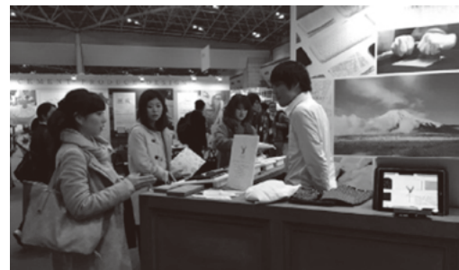
図3 ギフトショー出展の様子

試作品の一部を「第83回東京インターナショナルギフトショー」に出展、百貨店バイヤーやセレクトショップ購買担当者等の受容性評価を行った。その結果、コンセプト、製品デザインともに高い評価を得た。（図3）