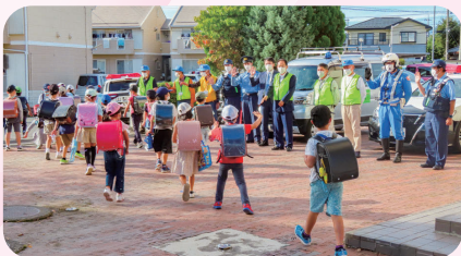
防犯ボランティア団体との合同見守り活動