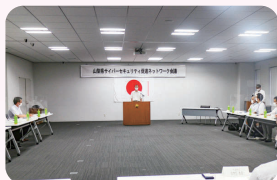
山梨県サイバーセキュリティ促進ネットワーク

また、県内の産業、学術機関、警察等官公庁の「産学官」の連携による「山梨県サイバーセキュリティ促進ネットワーク」を通じた、先制的なサイバーセキュリティ対策に取り組むとともに、県警察全体のサイバー犯罪に対する対処能力を高めるための取組として「サイバーセキュリティ競技会」を開催するなど、高度なサイバー犯罪に対応できる人材育成を推進しています。