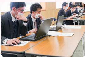
第3回サイバーセキュリティ競技会の状況

山梨県警察ホームページもご確認ください!! https://www.pref.yamanashi.jp/police/kurashi/cyber/index.html または、『山梨県警察 サイバー』で検索!!