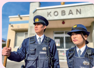
交番・駐在所活動

交番・駐在所を拠点とした活動やパトロール、山岳遭難・水難事故における救助活動、列車・鉄道施設内の警戒活動等、地域の安全を守り、事件・事故に迅速かつ的確に対応する活動を行っています。