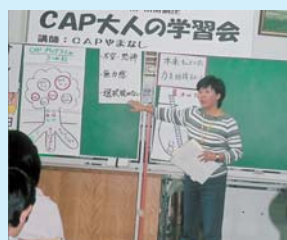
10/30(日) 「CAP大人の学習会」 講師 CAPやまなし