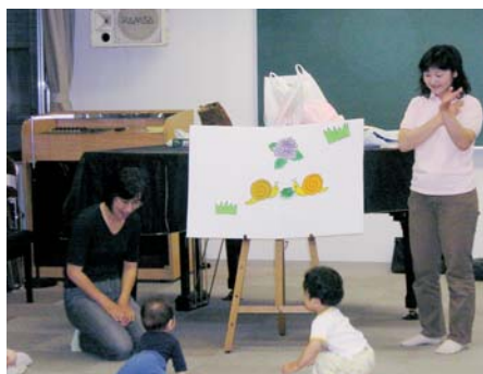
市民企画子育て支援講座(7回実施)