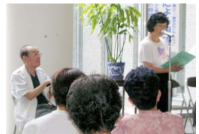
ひびきの会による「原爆の詩」等朗読会