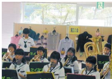
ミニコンサート(南部中吹奏楽部)

6月に集中してさまざまな講座を開き、それと併せて展示や、コンサート・お話を開催しました。