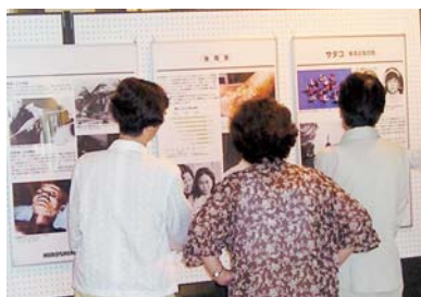
展示 広島原爆パネル