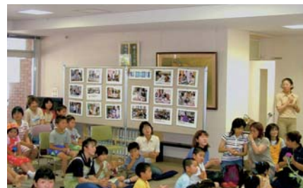
お話会(南部図書館ボランティア)