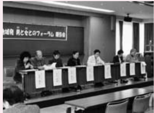
地域発男と女のフォーラム報告会（2月9日）