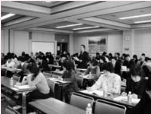
県男女共同参画推進リーダー研修会（2月9日）