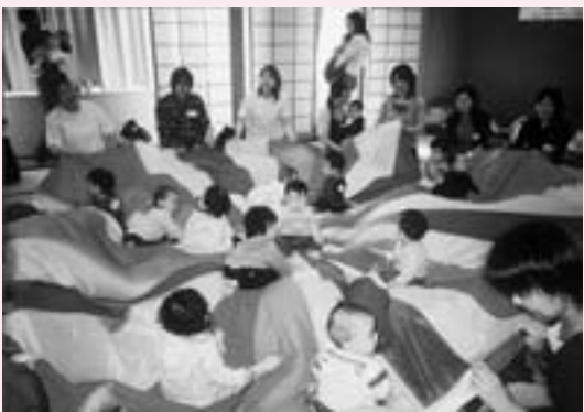
あんしん子育て講座（9月5日から全8回）