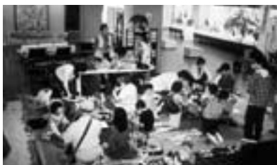
バルーンアートづくり