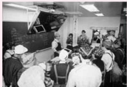
男の料理教室（12月9日）