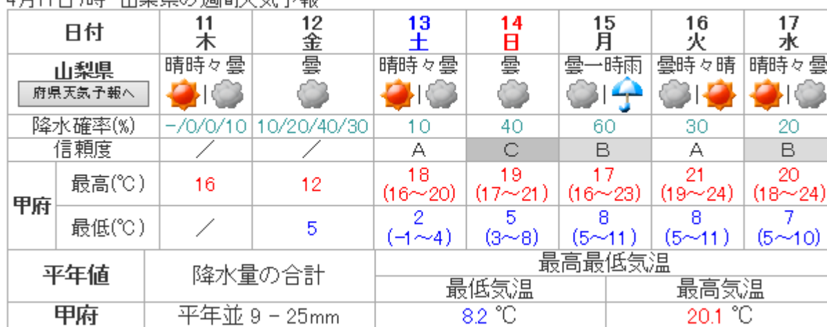
4月11日7時 山梨県の週間天気予報

果樹については、開花期を迎えていることから、結実の確保のために、次のような対策をお願いします。