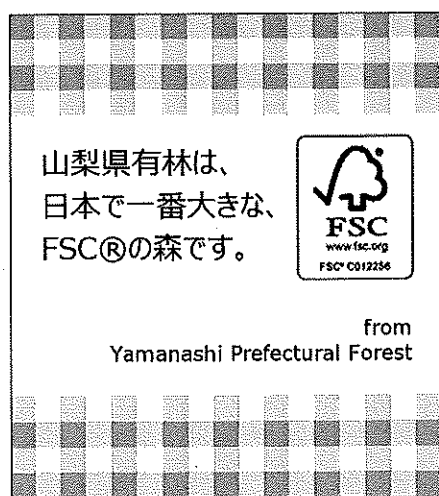
パッケージ内の台紙のデザイン