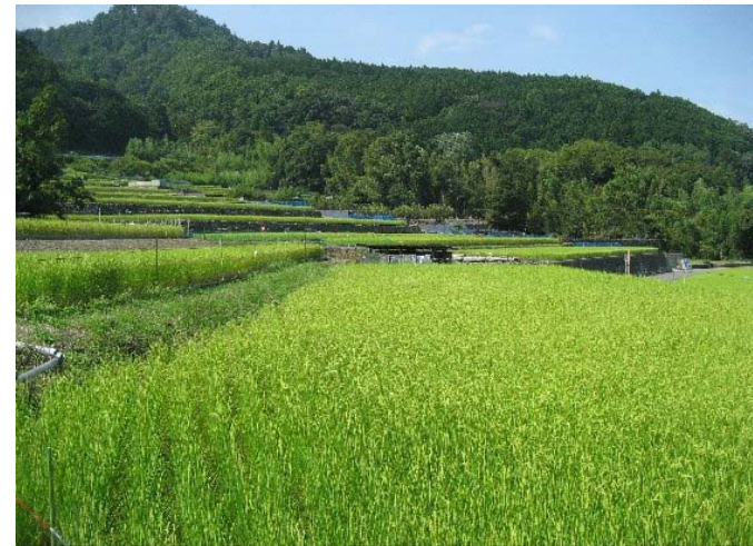
② 受益地の状況。 水稻を中心に果樹・野菜を含む複合経営を行っている。