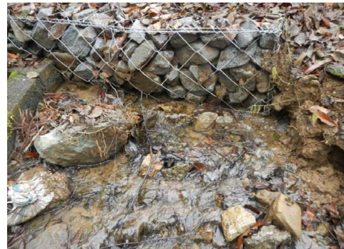
④ ため池下流の状況。 漏水によるパイピングが著しく、決壊した場合に甚大な被害のおそれがある。