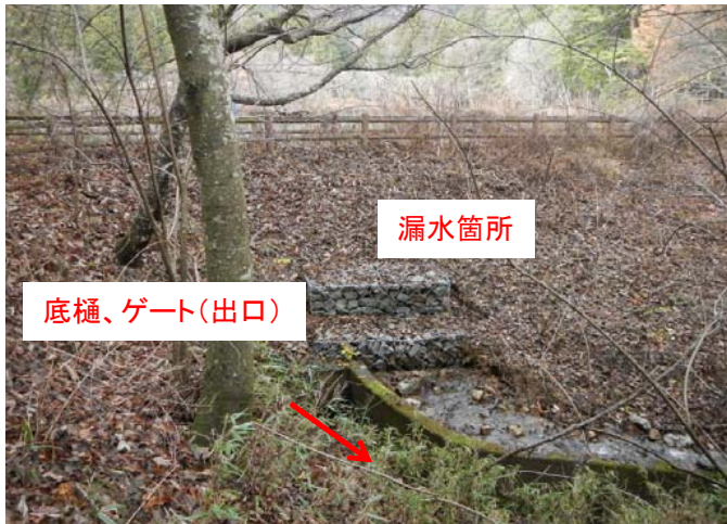
③ 提体下流法面の状況