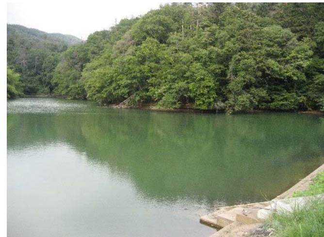
② 沢村堤ため池の全景