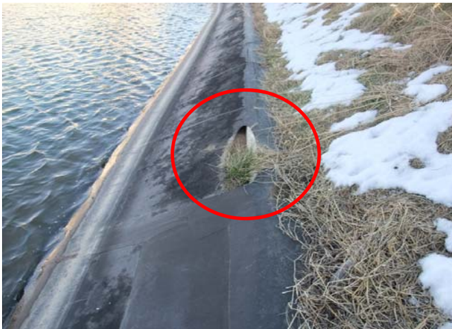
③ 堤体の破損状況。 遮水シートの破損により堤体へ水が流入し、危険な状