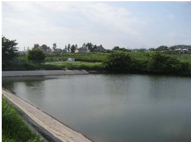
① ミツ沢ため池の全景