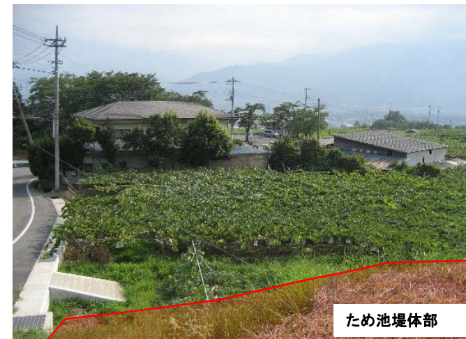
④ ため池下流の状況。 人家や公民館等の施設があり、大規模地震の際には 甚大な被害のおそれがある。