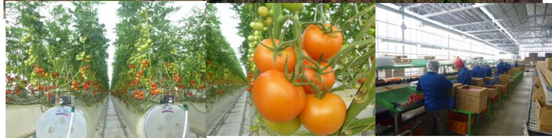
農業生産法人による野菜の施設栽培（トマト）

参入した農業法人が「農業企業コンソーシアム」を設立。加工・流通・販売にノウハウを有する各企業同士で構築したネットワークを活かし、農業の6次産業化や地域活性化に取り組む。