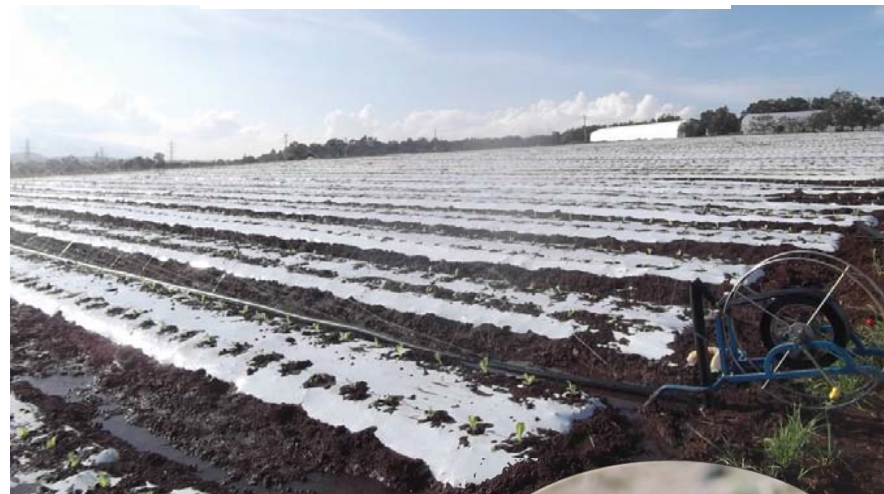
パイプによるドリップ灌水