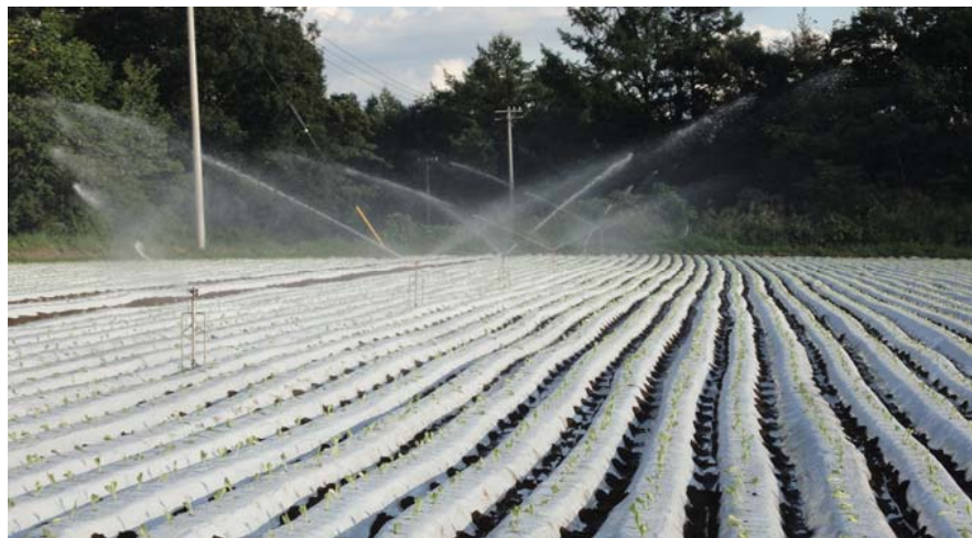
スプリンクラーによる灌水