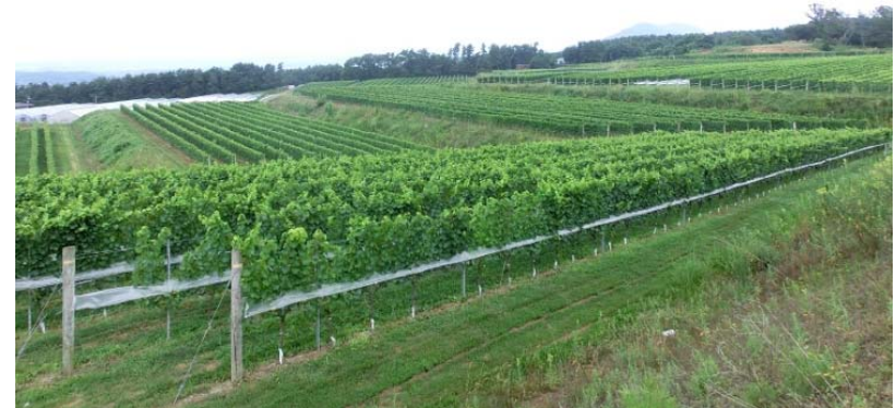
農業生産法人による醸造用ぶどう栽培