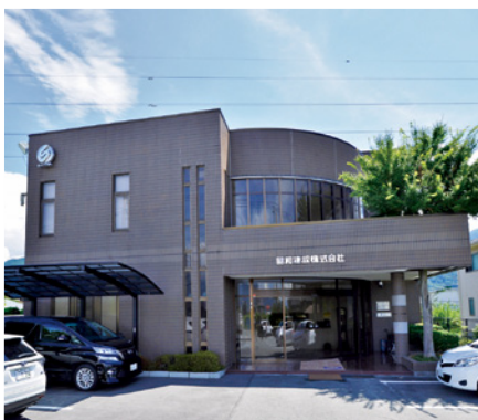
甲州市塩山熊野80-1 TEL 0553-32-1717

るので、若手社員の指導役にもなっております。 結婚、出産などの節目を迎えても安心して働ける環境が整っていれば、仕事においても自分の持っている力を十分発揮できるものです。そのために会社としてのサポートはとても重要であると私は考えています。