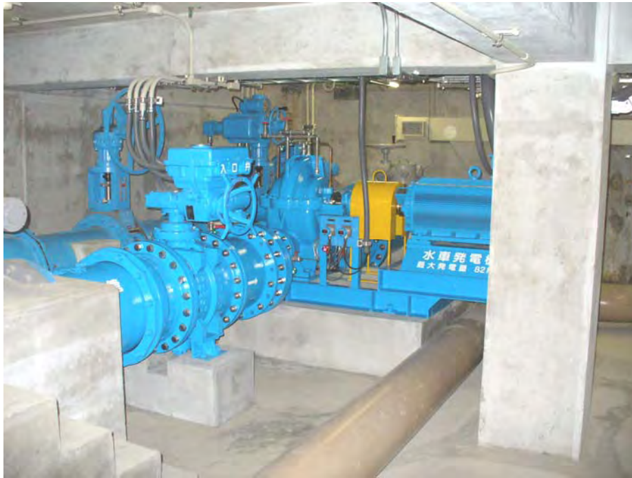
既設水道施設内に設置された水車発電機