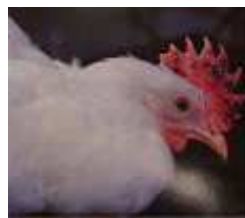
肉冠のチアノーゼ