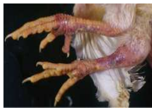
脚の浮腫、皮下出血