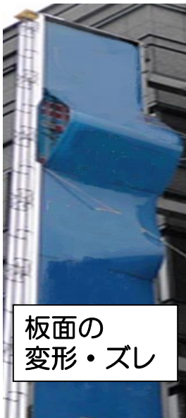
板面の 変形・ズレ