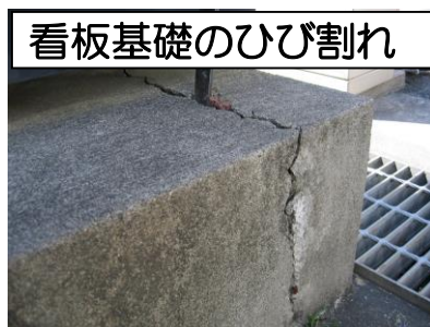
看板基礎のひび割れ