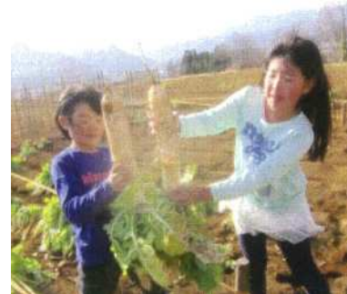
農業見本園での収穫体験の様子