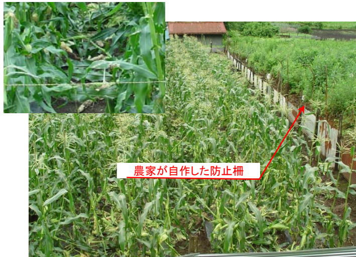
③シカによる被害を受けたスイートコーン畑。農家が自作する防止柵では獣害は防ぎ切れない。