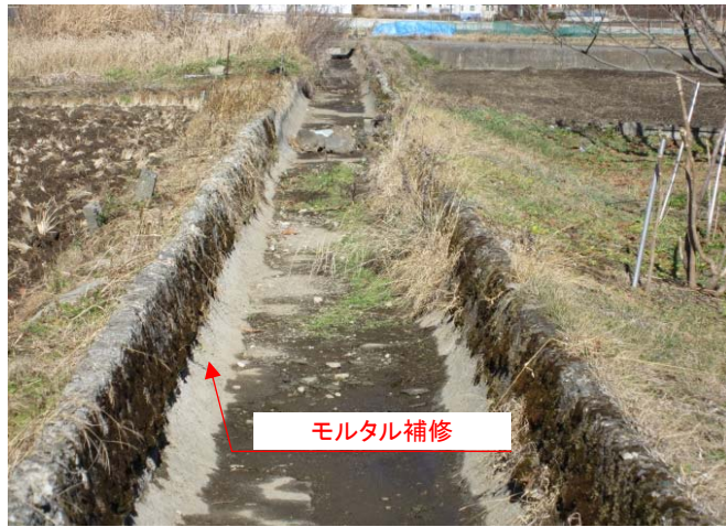
①漏水箇所を地元土地改良区がモルタルで補修しているが、老朽化により安定的な取水が困難となっている。