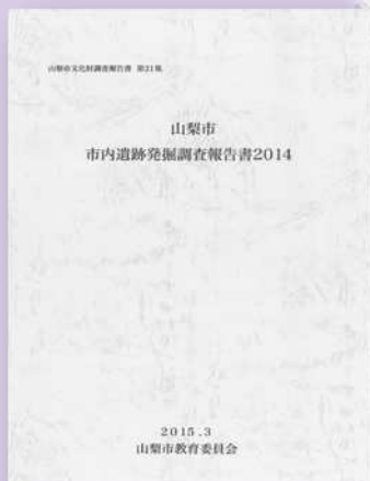
試掘調査の結果をまとめた報告書(遺跡台帳)

試掘調査の積み重ねと調査結果のデータ分析は、埋蔵文化財保護にとっての基盤であり、開発行為が増加する今日、ますますその重要性は高まっている。