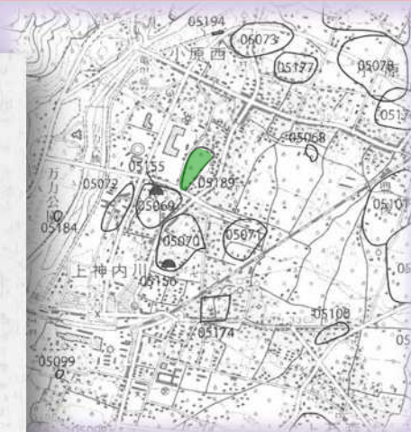
更新された遺跡範囲図