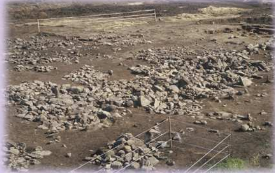
金生遺跡(整備前) (昭和58年2月7日指定)

山梨県の北西部、八ヶ岳南麓の標高約770mにある縄文時代後・晩期の集落跡である。県営圃場整備事業に先立ち昭和55年に発掘調査が実施されている。