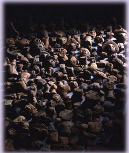
釈迦堂遺跡 土偶 (昭和63年6月6日指定)

昭和58年に国史跡に指定され、現在は史跡公園として整備・活用がなされ、草葺きの竪穴住居などが復元公開されている。