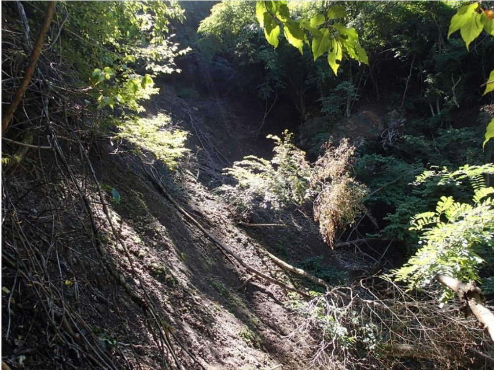
写真 9-9-1 A 沢最上流部の裸地