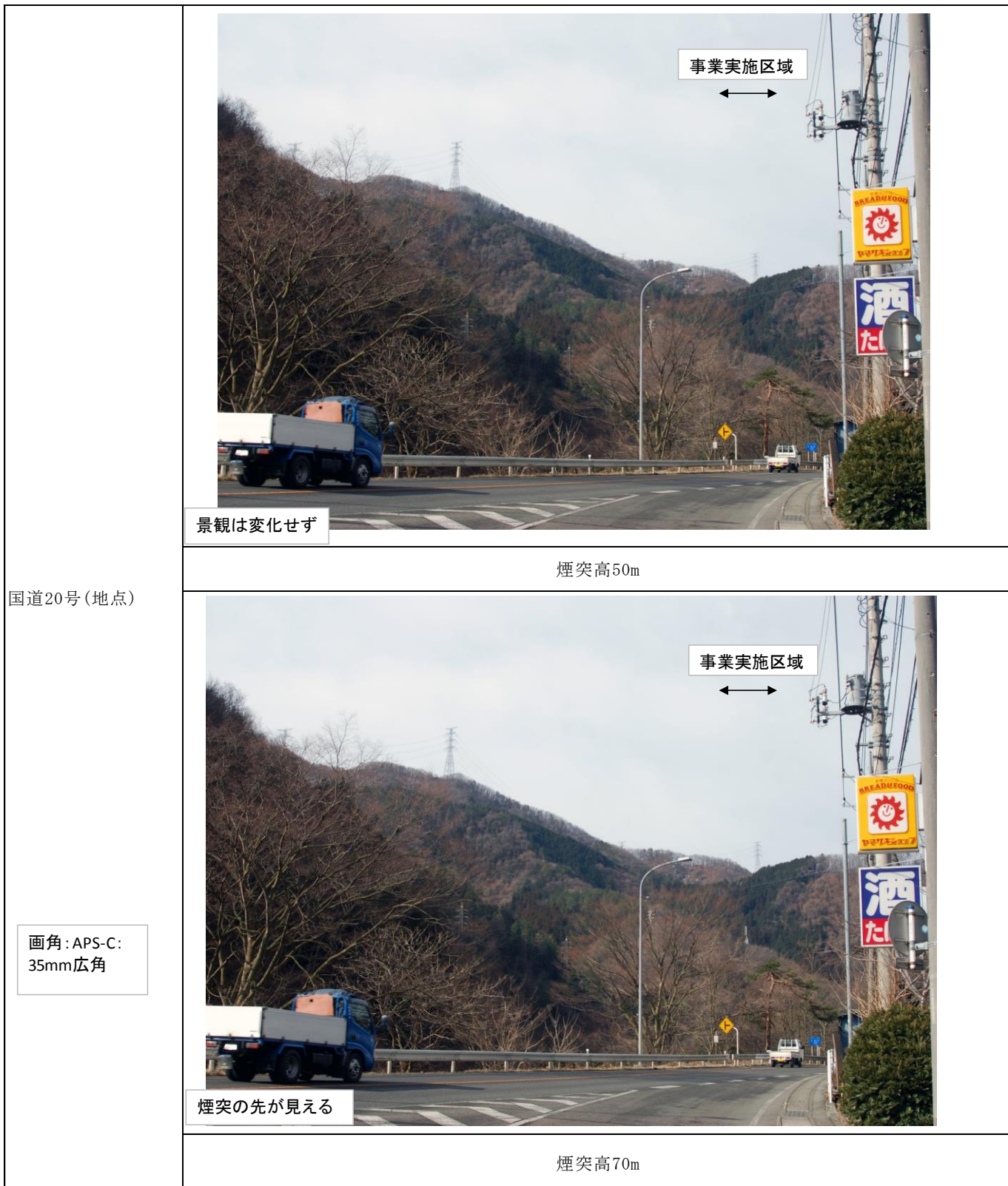
図 9-15-7(3) 景観予想図(国道 20 煙突高 50m、70m)