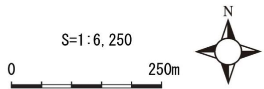
図9-15-6(1) 景観地点位置図 (東京から104.5km)