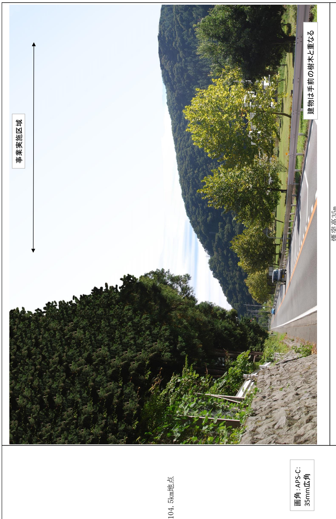
図 9-15-6(4) 景観予想図(国道 20 号沿道・東京から 104.5km、煙突高 35m : 秋季)