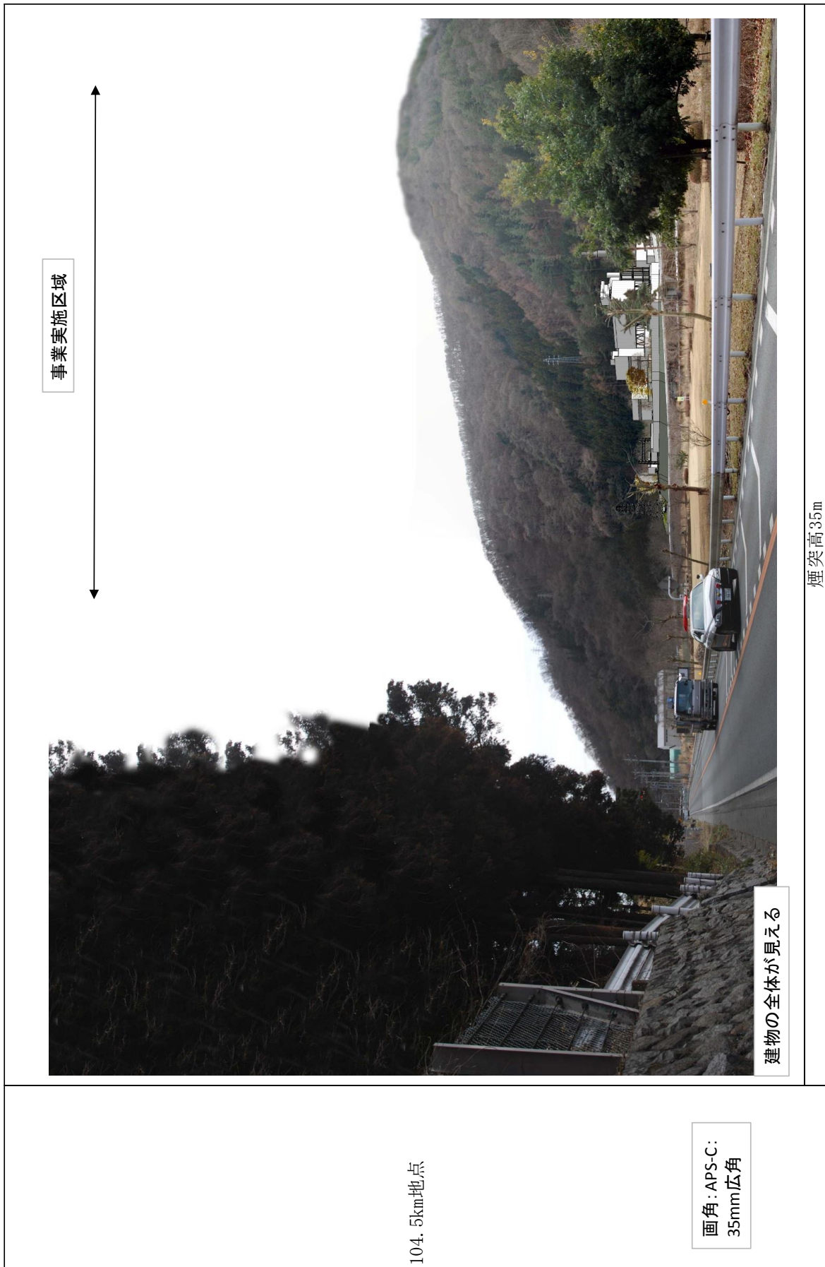
図 9-15-6 (5) 景観予想図(国道 20 号沿道・東京から 104.5km、煙突高 35m : 冬季)