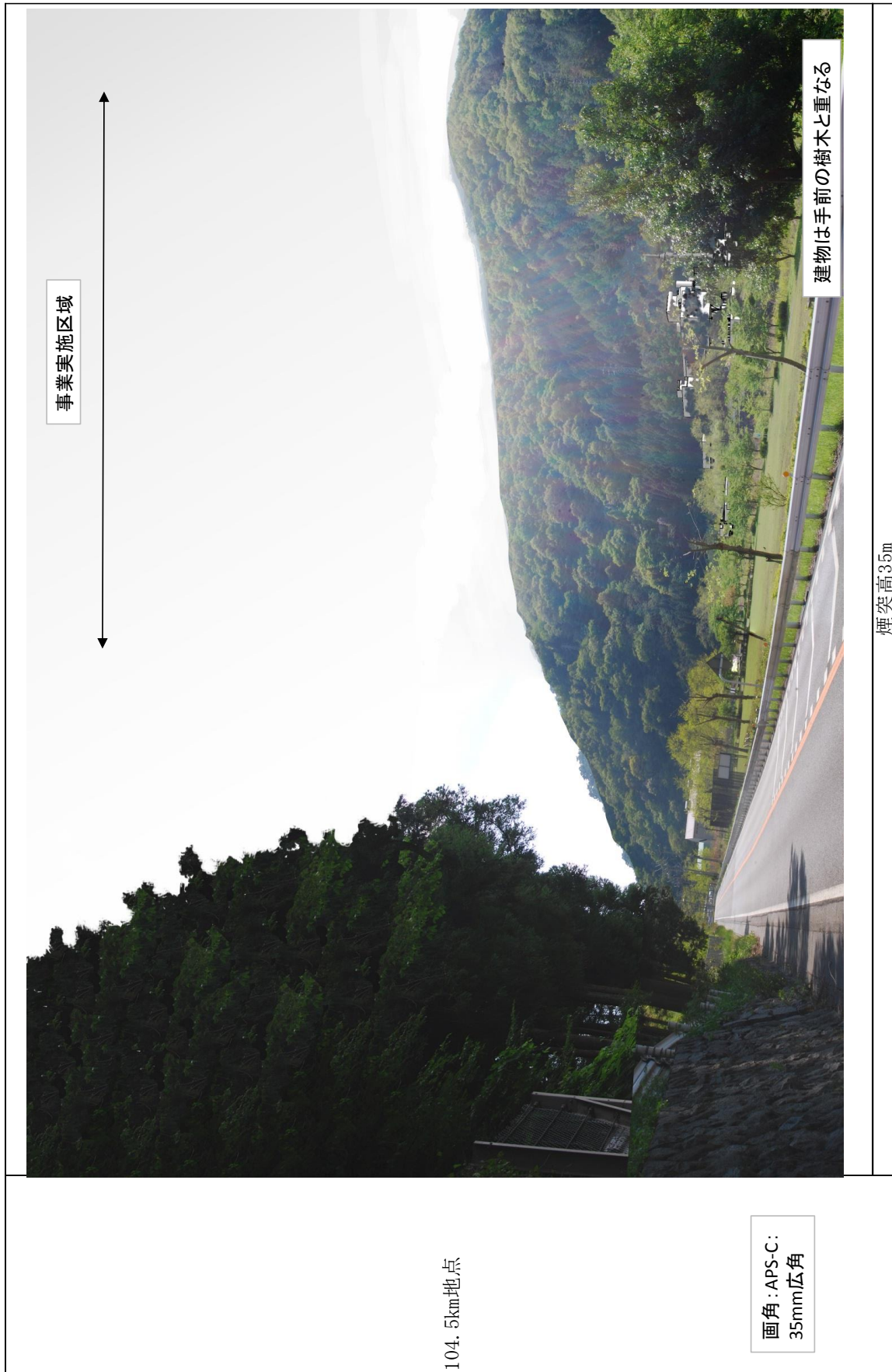
図 9-15-6 (2) 景観予想図(国道 20 号沿道・東京から 104.5km、煙突高 35m : 春季)