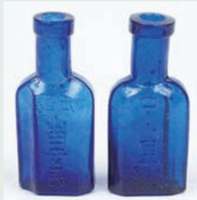
くぼみをもつガラス製目薬瓶 (富士川町鯉沢河岸跡出土)

県内各地から出土した近代の遺物をひも解くと、山梨を支えてきた産業の存在と戦争の傷跡が見えてきます。今回は、明治以降の近代に焦点を当て、忘れてしまいがちな記憶をすくい上げて紹介します。