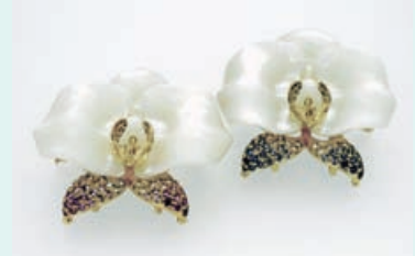
ブローチ兼ペンダント<胡蝶蘭>