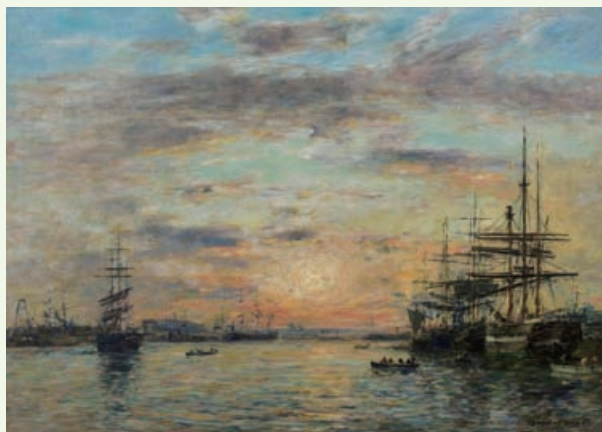
ウジェーヌ・ブーダン 《ル・アーヴル、ウール停泊地》 1885年 エヴル美術博物館

フランス北部ノルマンディーは、フランスで最も人気のある保養地の一つです。風光明媚なこの地の古い町並みや遺跡は19世紀初頭、英仏ロマン主義の画家たちに度々取り上げられました。その後、印象派をはじめとする画家たちは、パリからノルマンディーへと赴き、移ろいゆく光の表情や余暇を楽しむ近代生活の情景を描きました。今回は、国内外所蔵の絵画や写真約100点により、主に19世紀初頭から20世紀中頃までの、ノルマンディーにおける風景表現を紹介します。