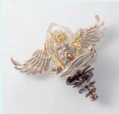
ブローチ兼ペンダント<次元上昇>