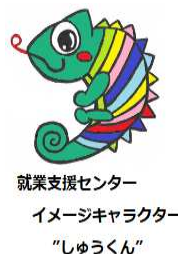
就業支援センター イメージキャラクター "しゅうくん"