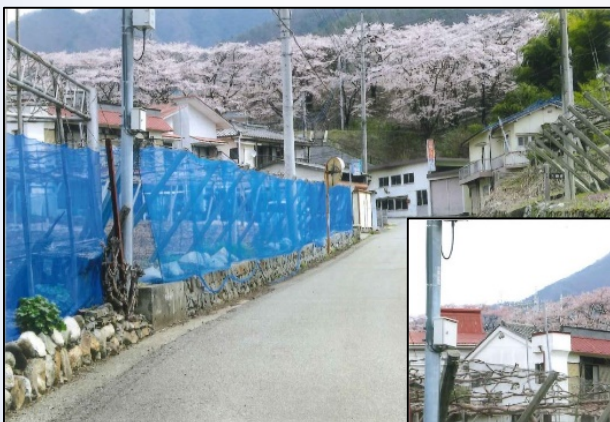
(張替前)景観に影響を与える青いネット