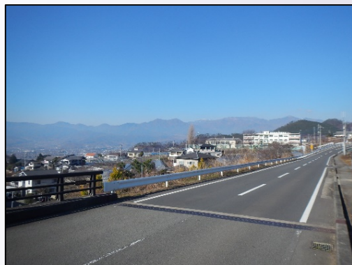
修景予定箇所 (令和2年度実施予定)