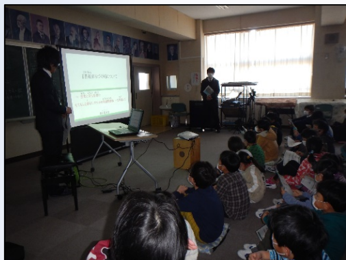
菱山小学校での勉強会の様子