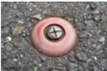
中心点鋤・杭イメージ