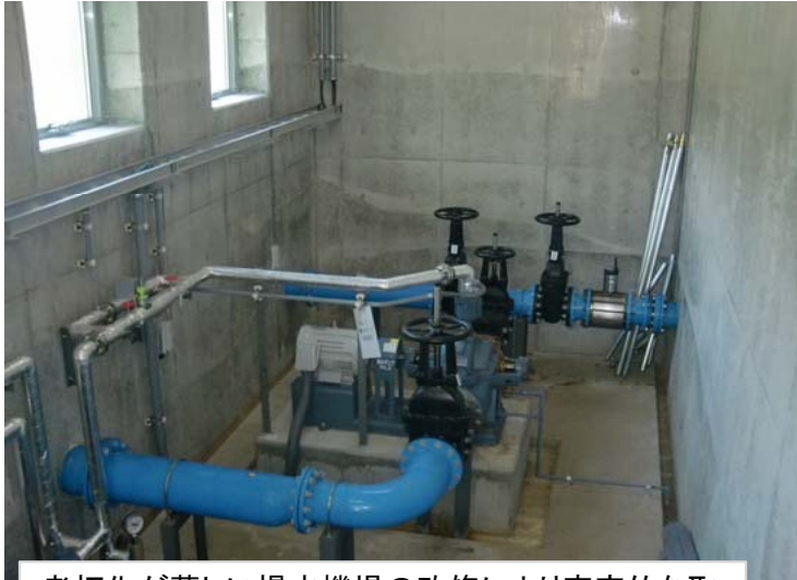
老朽化が著しい揚水機場の改修により安定的な取水が可能となった。