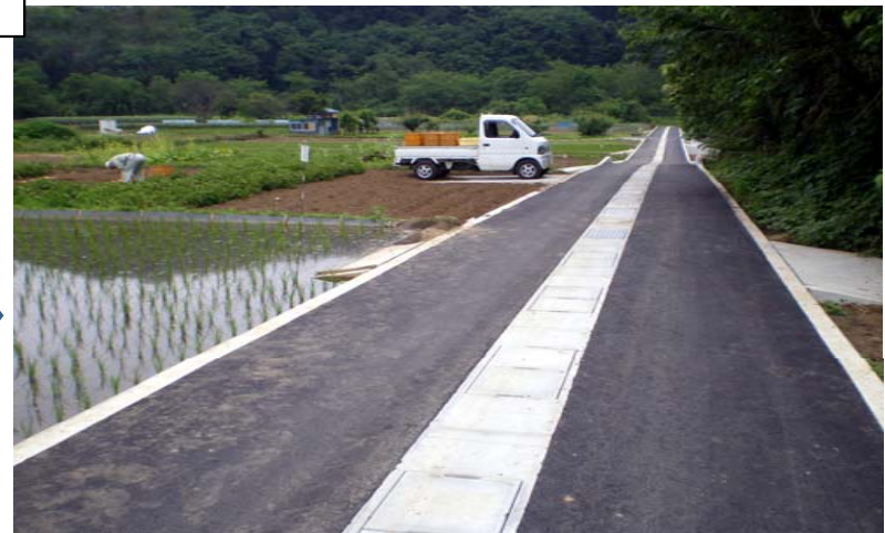
農道改良とともに、用排水路を改修することで、大幅な農作業効率のUPを図った。