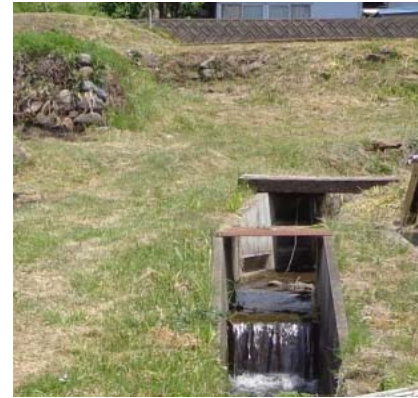
水路の改修により、安定した用水供給及び排水が可能となった。