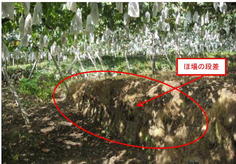
①受益地の状況(段差のある狭小なほ場が分散している)