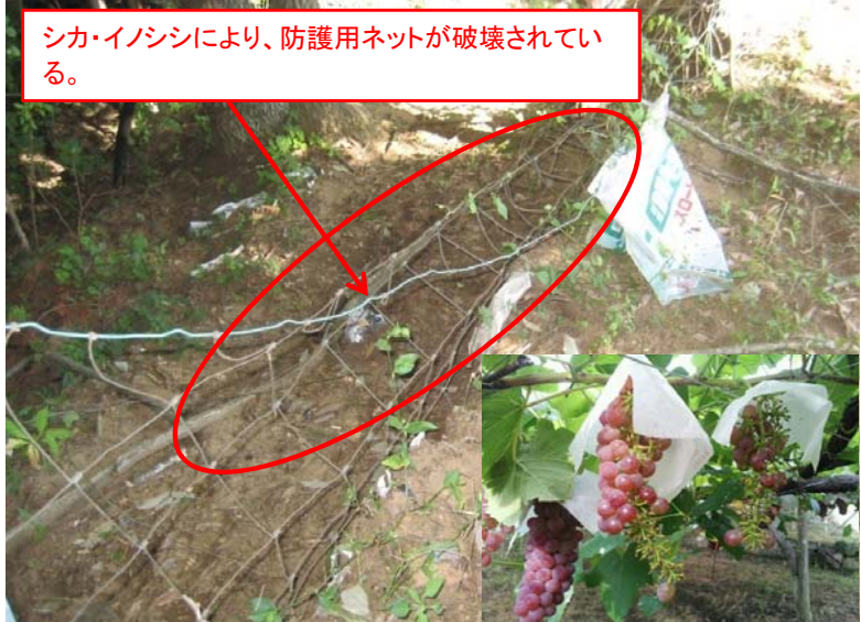
②獣害(シカ、イノシシ)による被害の状況