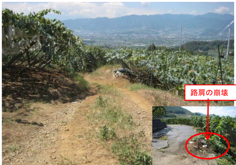
③農道の幅員が狭小で未舗装な状況