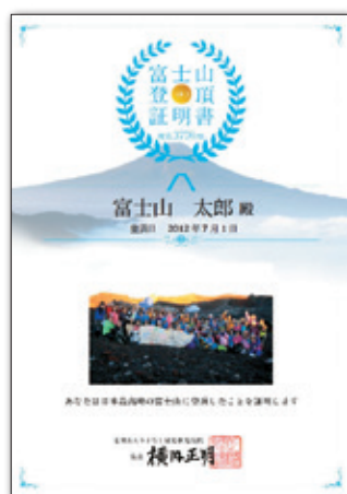
登頂証明書イメージ

登頂＝山頂まで登りきった方へ発行する証明書です。(1通 1,000円〔税抜〕)＋送料)