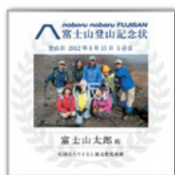
登山記念状イメージ

登頂または登山したことが証明できる写真データがあれば、過去の登山に対する証明書も発行できます。お申し込みは下記ホームページから！