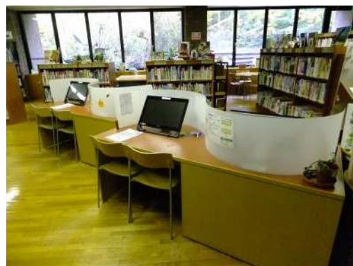
環境情報センター

本センターでは、環境に関する図書・DVD等を年々充実させていることに加え、コンピュータネットワークの整備等により、これら環境情報の提供の際の利便性の向上を図っています。さらに「ニューズレター」「情報センターだより」「メールマガジン」の発行等により、研究成果ほか研究所の各種活動の紹介も行っています。