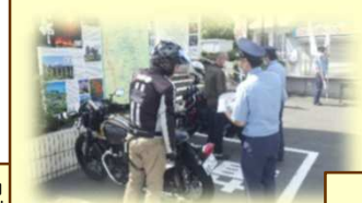
通学時間帯の立番状況