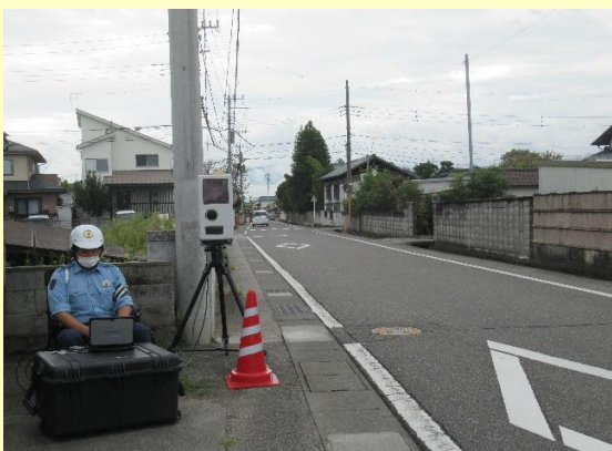
通学路での速度取締りの実施状況