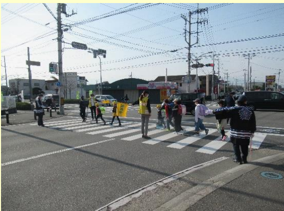
通学路における街頭活動の状況