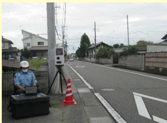
通学路での速度取締りの実施状況