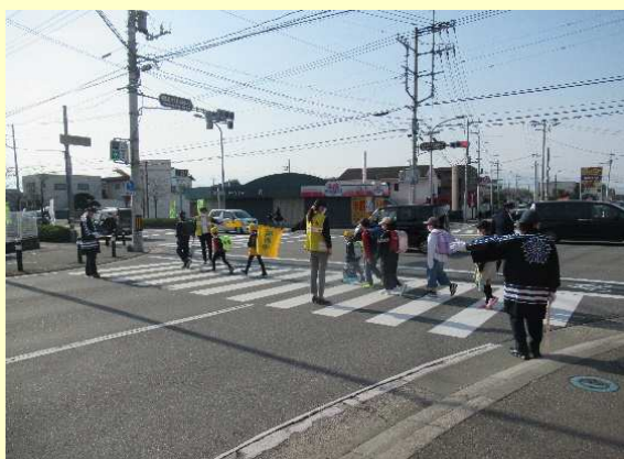
通学路における街頭活動の状況