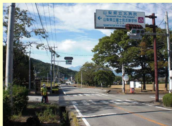
速度取締りの実施状況