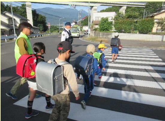
通学路における街頭活動の状況