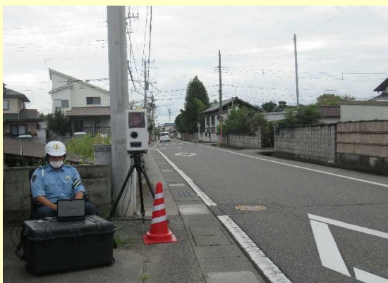
通学路での速度取締りの実施状況