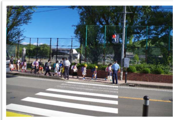
通学路における見守り活動