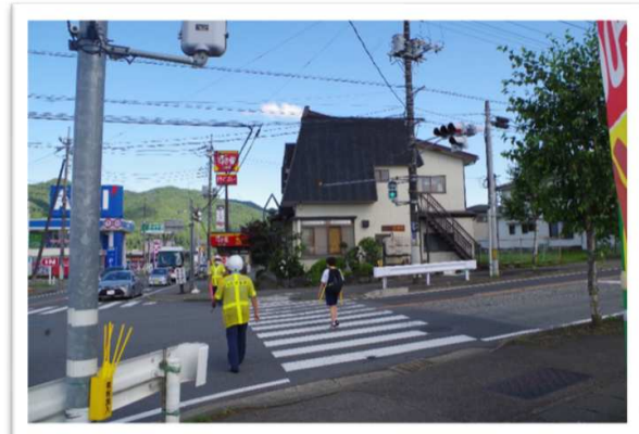
交通事故多発場所における街頭活動