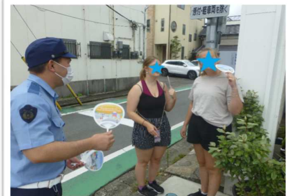
外国人観光客に対する交通指導