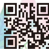
詳しくはこちらから

営業時間 売店 9:00~18:00 キッチン 9:00~17:00 (L.O.16:30) 休業 年末年始