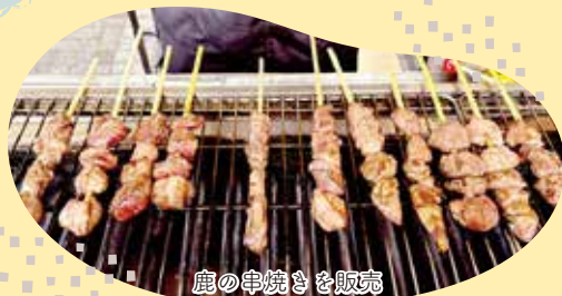
鹿の串焼きを販売