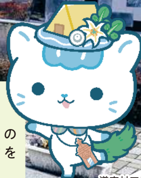
道志村マスコット ななりん