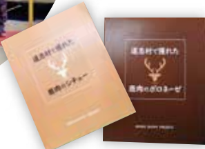
鹿肉のポロネーゼと鹿肉のシチューはネットショップでも購入可能