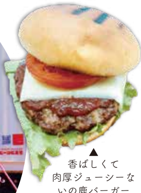
香ばしくて肉厚ジューシーないの鹿バーガー

また、ジビエの魅力を気軽に味わえる「ジビエコーナー」も設けられ、人気の「いの鹿バーガー」や「鹿肉グリル」など道志ならではの特別な味わいがそろいます。清流と森に囲まれた道志で、ここだけの「野生のごちそう」を楽しみませんか？