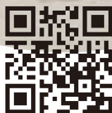
詳しくはこちらから