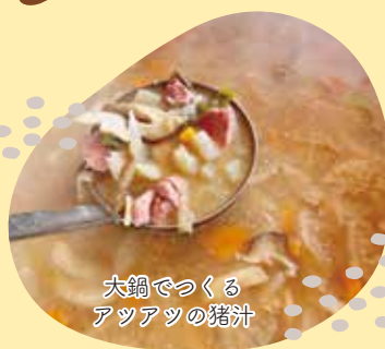
大鍋でつくるアツアツの猪汁