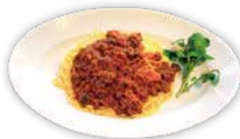
レストラン「手づくりキッチン」の鹿肉ボロネーゼ

観光案内や無料休憩所に加え、地元食材が並ぶ農産物直売所、特産品であるクレソンを使ったメニューや「山の恵み」を感じるジビエ料理が楽しめるレストラン「手づくりキッチン」を備え、四季折々の自然とともに「食と体験」を提供しています。さらに、旅を快適にする設備も充実しており、ドライブやツーリングの休憩だけではなく、自然を感じながら、道志ならではの味覚と出会えるスポットです。