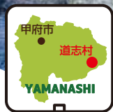
甲府市 道志村 YAMANASHI

山梨県の東南端、神奈川県との県境に位置する山あいの村。村の中央を清流として名高い道志川が流れ、四方を豊かな山々に囲まれています。