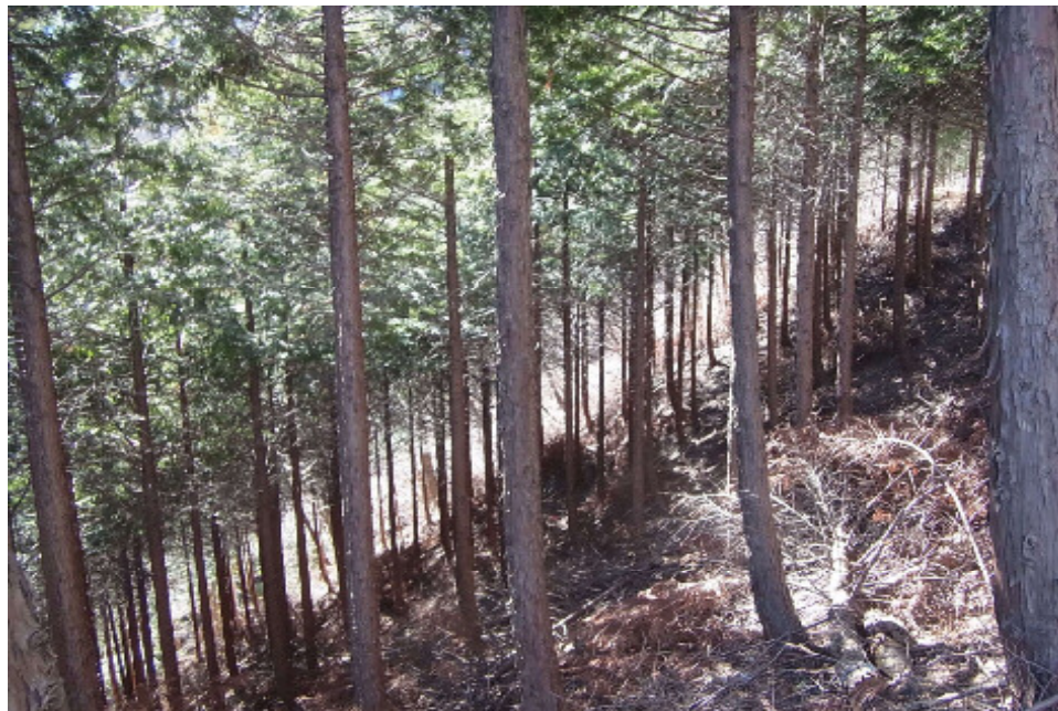
林道沿線における森林整備の状況