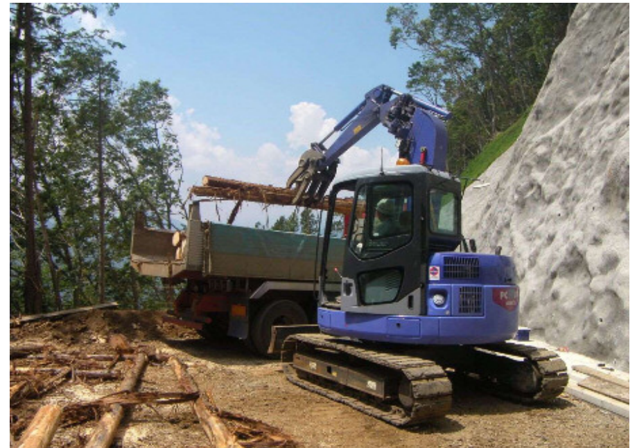
林道沿線における収獲木材の搬出状況