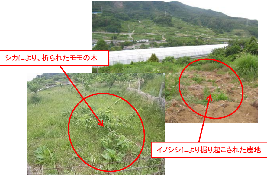
②獣害(シカ、イノシシ)による被害の状況