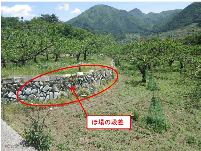
①受益地の状況(段差のある狭小なほ場が分散している)