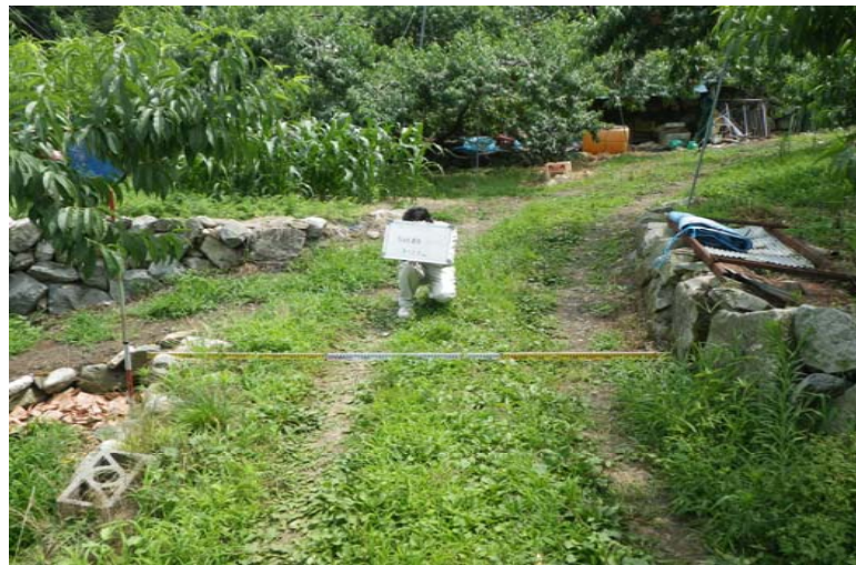
③農道の幅員が狭小で未舗装な状況