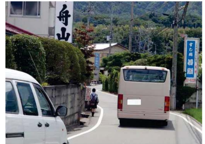
② 国道52号側から甘利山公園側を望む