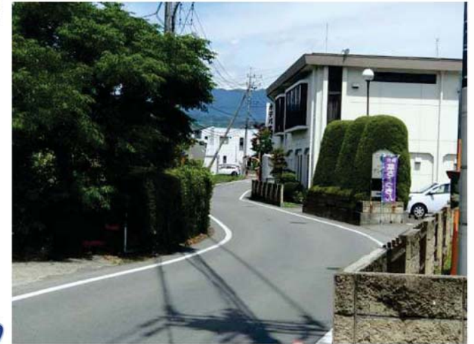
① 甘利山公園側から国道52号側を望む