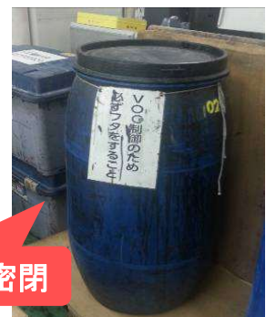
廃棄物容器の密閉

※「VOC拡散防止のため、必ずフタを閉めること」などの貼り紙をするとより効果的です。