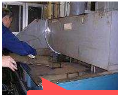
洗浄槽のフタ閉め