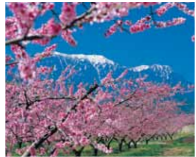
2 新府桃源郷と南アルプス