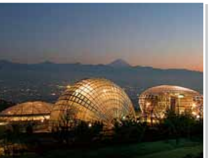
8 笛吹川フルーツ公園