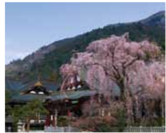
5 身延山久遠寺としだれ桜