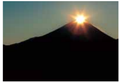
4 富士川町高下から望むダイヤモンド富士