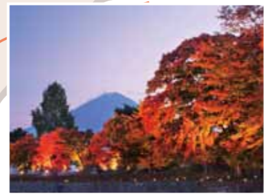
12 河口湖もみじ回廊