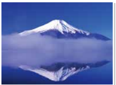
13 山中湖に映る逆さ富士