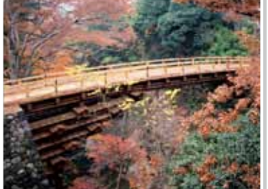
11 猿橋 (日本三奇橋の1つ)