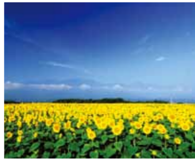
1 明野のヒマワリ畑