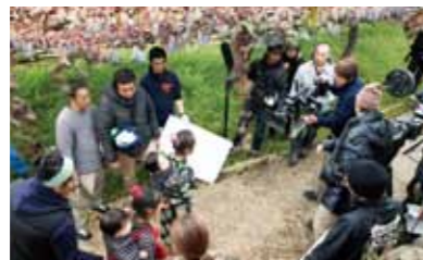
「花子とアン」甲州市内でのロケ風景

富士の国やまなしフィルム・コミッションでは、映画やテレビドラマのロケの誘致及び支援を行い、映像を通じた情報発信やイメージアップに力を入れています。2013年には、NHK連続テレビ小説「花子とアン」のロケも行われました。