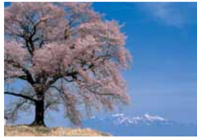
3 ハケ岳とわに塚の桜