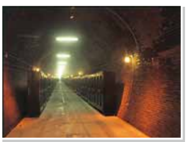
10 勝沼トンネルワインカーブ