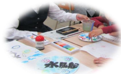
親子カルチャー教室