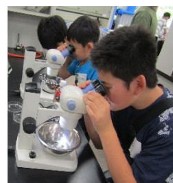
帝京科学の夏まつり