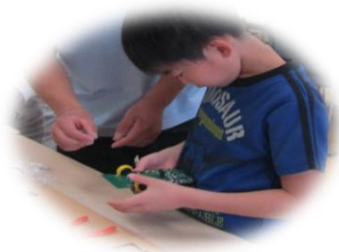
親子ものづくり教室