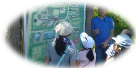
ジュニアリーダー合同キャンプ