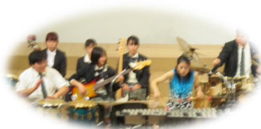
月江寺学園音楽祭