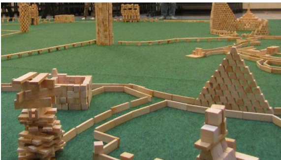
令和元年「つみきのひろば」より

「森で遊び 森に学び 森を育てる」をモットーに、シオジ森の学校は、2006年(平成18年)に「爽やかな空気とおいしい水を生み出す源である豊かな森に恵まれた地域の子もたちに、この地に暮らす楽しみ、喜び、そして何より誇りをもってほしい」との願いから誕生し、今年で15周年を迎えます。