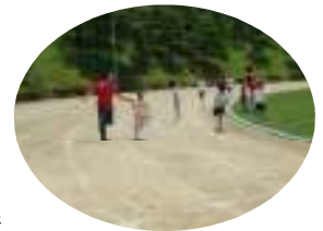
交流リレーの様子