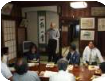
御師大国屋さんにて

地域教育推進担当の県内4教育事務所の職員が、自らが地域の現状や諸施設を知り、見識を深めることを目的に、隔月で実施される研修会の第1回目が、7月4日(水)、当事務所が担当として、富士吉田を会場に開かれました。