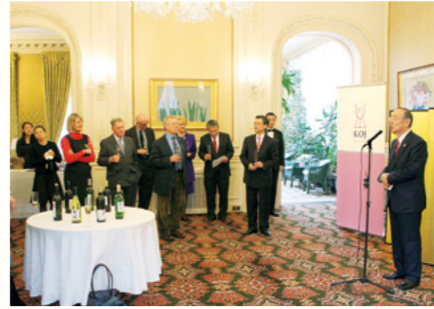
トップジャーナリストに甲州ワインの魅力をPRする横内知事

甲州ワインの輸出を目指すロンドンでのプロモーションで、横内知事がトップセールスを行いました。 今回は、在英日本国大使館の全面的な協力の下、ワイン界のトップジャーナリストを招待した昼食会を開催。ユネスコ無形文化遺産に登録された和食と甲州ワインの相性の良さを実感してもらいました。参加者からは「本日もあって、甲州ワインはロンドンの地に根を下ろし、世界水準のワインになった」という最高の賛辞をいただきました。