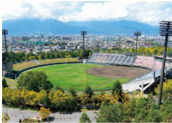
ネーミングライツで「山日YBS球場」に愛称が決まった小瀬スポーツ公園野球場

企業が公共施設のスポンサーとなり愛称を付けるネーミングライツが、小瀬スポーツ公園野球場に導入されました。株式会社山梨放送がスポンサーに決定し3月1日から「山日YBS球場」の愛称が使用されています。 県では、この愛称が皆さんに親しまれ定着するよう普及に努めていきます。 同球場の他に、小瀬スポーツ公園陸上競技場に「山梨中銀スタジアム」、県民文化ホールに「コラーナ文化ホール」、八ヶ岳薬用植物園に「シミック八ヶ岳薬用植物園」の愛称が付けられています。