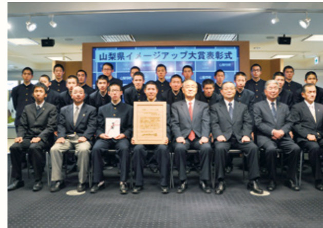
イメージアップ大賞を受賞した駅伝部員たち

都大路を舞台に行われた全国高校駅伝で県勢初優勝を果たした山梨学院大学付属高校男子駅伝部に、1月14日、山梨県イメージアップ大賞を贈呈しました。 チーム一丸となつての快走でたすきをつなぎ、ゴール前でのデッドヒートを制し優勝のテープを切った瞬間は、県民に大きな歓喜と感動を与え、本県のイメージアップに大きく貢献しました。 今回の優勝が、今夏、本県を含む南関東地区で開催される高校総体での県勢の活躍につながることを期待されます。