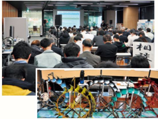
大盛況となった小水力発電講座 右下は、展示された小水力発電機の模型