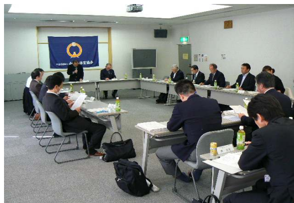
「公益財団法人山梨県体育協会競技力向上対策本部会議」