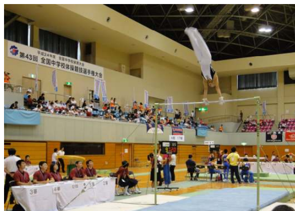
全国中学校体育大会体操競技