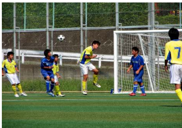
県総合体育大会サッカー競技

県では小中学校体育連盟に対し、指定校における運動部活動の活動経費の一部を助成します。